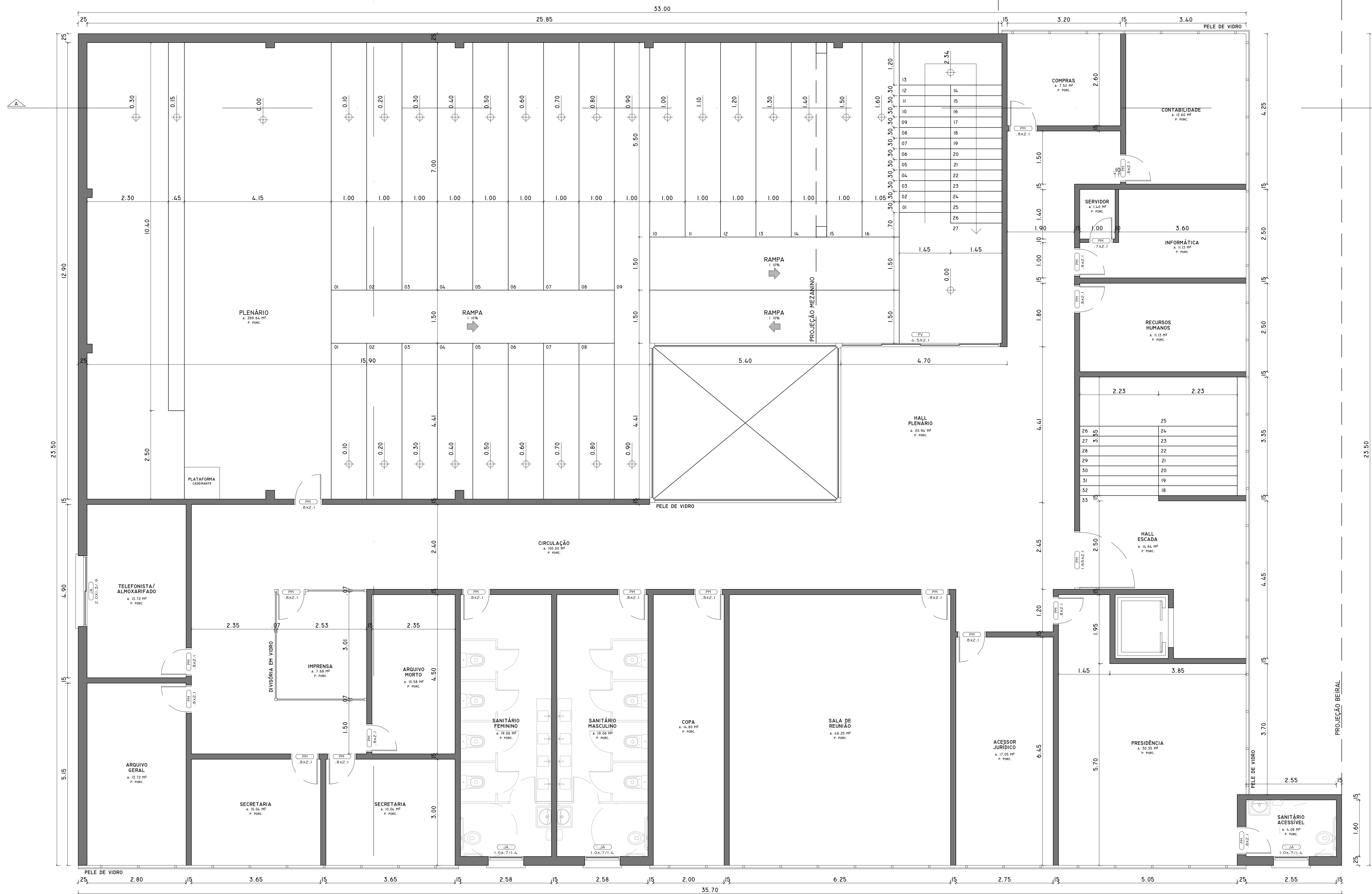
PLANTA BAIXA TERCEIRO PAV. ÁREA: 780.90 M² ESC. 1/50